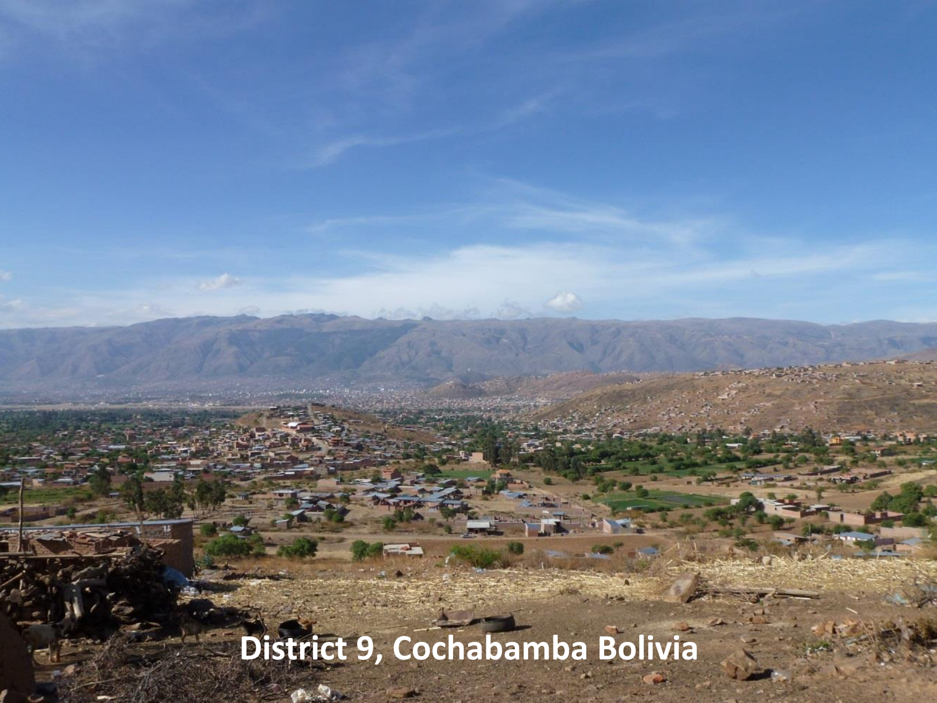
District 9, Cochabamba Bolivia